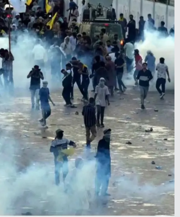
సైన్యాన్ని కూడా భారీగా మోహించింది. ఈ రెడ్ జోన్ లో పలు ప్రభుత్వ కార్యాలయాలు, ప్రధాని నివాసం, పార్లమెంటు, రాదుబార

పాకిస్తాన్ లో ఉద్రిక్త పరిస్థితులు నెలకొన్నాయి. మాజీ ప్రధాని ఇమ్రాన్ ఖాన్ ను జైలు నుంచి విడుదల చేయాలని డిమాండ్ చేస్తూ 'పాకిస్తాన్ టెలిఫోన్ ఈజిప్తాన్' (టీటీఐ) కార్యకర్తలు పెద్ద ఎత్తున నిరసనలు చేస్తున్నారు. దేశం నుంచి నలుమూలలకు చెందిన పీటీఐ కార్యకర్తలు ఆందోళనలు చేస్తూ రాజధాని ఇస్లామాబాద్ కు వస్తున్నారు. దీంతో అనేక చోట్ల హింసాత్మక ఘటనలు జరుగుతున్నాయి. ఇమ్రాన్ ఖాన్ ఆదేశాలతో తన పార్టీ నేతలు, కార్యకర్తలు షాబజ్ షరీఫ్ ప్రభుత్వానికి వ్యతిరేకంగా 'డు ఆర్ డై' నిరసనను చేసేందుకు రాజధానికి వెళ్తున్నారు. పలువురు పీటీఐ నేతలు, కార్యకర్తలు ఇప్పటికే ఇస్లామాబాద్ కు వచ్చారు. ఈ నేపథ్యంలోనే ప్రభుత్వం ప్రస్తుతం ఇస్లామాబాద్ ను రెడ్ జోన్ గా ప్రకటించింది. ఇక్కడ పాకిస్తాన్