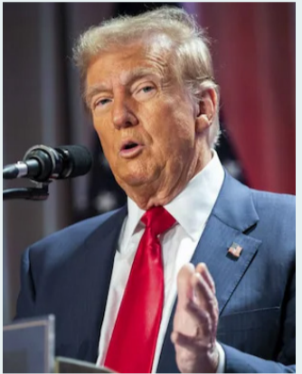
ఉన్నాయి. ఇందులో భాగంగానే తాజాగా ఆయన నిర్ణయం తీసుకోవడం గమనార్హం. మరోవైపు ఈ సుంకాలు దేశ వ్యధిని దెబ్బతీస్తాయని, అలాగే ప్రవ్యల్సాన్ని కూడా పెంచుతాయని పలువురు ఆర్థికవేత్తలు హెచ్చరికలు చేస్తున్నారు. అయితే కెనడా నుంచి అమెరికాకు వెళ్లే వస్తువులపై 25 శాతం సుంకాలు విధించడాన్ని కెనడా నేత జిగ్మెట్ సింగ్ అభ్యంతరం వ్యక్తం చేశారు. ఈ నిర్ణయాన్ని ఆయన వ్యతిరేకించారు. సుంకాల పెంపునకు వ్యతిరేకంగా పోరాడాలని పిలుపునిచ్చారు.

అమెరికా అధ్యక్ష ఎన్నికల్లో ట్రంప్ గెలిచిన సంగతి తెలిసిందే. వచ్చే ఏడాది జనవరి 20న ఆయన అధ్యక్షునిగా బాధ్యతలు స్వీకరించనున్నారు. అయితే ట్రంప్ వివిధ దేశాల నుంచి దిగుపతి అయ్యే వస్తుల సుంకాలపై కీలక నిర్ణయం తీసుకోనున్నారు. మెక్సికో, కెనడా దేశాల నుంచి దిగుమతి అయ్యే వస్తువులపై 25 శాతం సుంకం విధించనున్నట్లు తెలిపారు. ఈ వేదకు ఆయన ట్విట్ లో పోస్ట్ చేశారు. చట్టవిరుద్ధమైన మాదక ద్రవ్యాల సరఫరా, వలసలకు వ్యతిరేకంగా ఈ నిర్ణయం తీసుకున్నట్లు ట్రంప్ పేర్కొన్నారు. "జనవరి 20న నా మొదటి ఎగ్జిక్యూటివ్ ఆర్డర్లో ఒకటిగా మెక్సికో, కెనడా నుంచి అమెరికాకు వచ్చేటటువంటి అన్ని ఉత్పత్తులపై 25 శాతం సుంకం విధించేందుకు అవసరమైన డాక్యుమెంట్స్ పై సంతకం చేస్తానని" చెప్పారు. దీంతోపాటు చైనా వస్తువులపై కూడా 10 శాతం సుంకం విధించాలని నిర్ణయం తీసుకున్నట్లు మరో పోస్ట్లో రాసుకొచ్చారు. ట్రంప్ ఆర్థిక అణింపడాల్లో సుంకాలు కీలకంగా ఉన్నాయి. తాను అధ్యక్షుడిగా అయ్యాక వివిధ దేశాల నుంచి వచ్చే వస్తువులపై దిగుమతి సుంకాలు విధించానని చాలాసార్లు చెప్పిన సందర్భాలు ఉన్నాయి. ఇందులో భాగంగానే తాజాగా ఆయన నిర్ణయం తీసుకోవడం గమనార్హం. మరోవైపు ఈ సుంకాలు దేశ వ్యధిని దెబ్బతీస్తాయని, అలాగే ప్రవ్యల్సాన్ని కూడా పెంచుతాయని పలువురు ఆర్థికవేత్తలు హెచ్చరికలు చేస్తున్నారు. అయితే కెనడా నుంచి అమెరికాకు వెళ్లే వస్తువులపై 25 శాతం సుంకాలు విధించడాన్ని కెనడా నేత జిగ్మెట్ సింగ్ అభ్యంతరం వ్యక్తం చేశారు. ఈ నిర్ణయాన్ని ఆయన వ్యతిరేకించారు. సుంకాల పెంపునకు వ్యతిరేకంగా పోరాడాలని పిలుపునిచ్చారు.