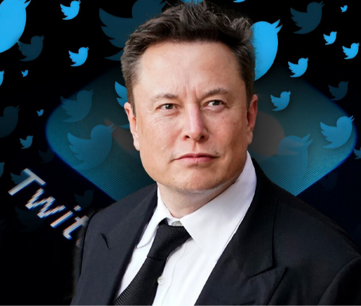
విషయాల్లో విమర్శలు ఎదుర్కొంటుంది. ఈ క్రమంలోనే మస్క్ ఎఫ్ 35 ఫైటర్ జెట్ లను వ్యతిరేకిస్తూ పోస్ట్ పెట్టడం గమనార్హం. ట్రంప్ సంచలన నిర్ణయం.. ఆ దేశాలకు జగ్ ఫాక్ ట్రంప్ వివిధ దేశాల నుంచి దిగుపతి అయ్యే

అమెరికా అధ్యక్ష ఎన్నికల్లో విజయం సాధించిన ట్రంప్ డోజ్ సంయుక్త సారథులుగా ప్రపంచ కుబేరుడు ఎలాన్ మస్క్, వివేక్ రామస్వామి లను నియమించిన విషయం తెలిసిందే. ఈ క్రమంలో అమెరికా ప్రభుత్వ వ్యయాన్ని తగ్గించేందుకు మస్క్ పలు సూచనలు ఇచ్చారు. ఆధునిక ఫైటర్ జెట్ ల కంటే డ్రోన్ ల వల్ల ఎక్కువ మేలు జరుగుతుందని పేర్కొన్నారు. భవిష్యత్తు యుద్ధాలు డ్రోన్లతోనే జరుగుతాయన్నారు. ఈ వేదకు ఆయన ఎక్స్ వేదికగా ఓ పోస్ట్ పెట్టారు. డ్రోన్ ల వినియోగ కాలంలో మానవ సహాయ ఫైటర్ జెట్ లను వాడటం లేదు. ఎందుకంటే అవి ఫైలట్ లను చంపేస్తున్నాయి. అయినా ఇంకా కొంతమంది ఎఫ్ 35 వంటి మనుషులు నడిపే యుద్ధ విమానాలను తయారు చేస్తున్నారు. అయితే ఆ డిజైన్ లు నేటి అవసరాలకు అనుగుణంగా లేవు అని మస్క్ వాసుకొచ్చారు. ఎఫ్ 35 ఫైటర్ జెట్ లు ప్రపంచంలోనే అత్యంత అధునాతన యుద్ధ విమానాలు. దీనిలో అధునాతన ఫీచర్లు, రాదార్ గుర్తించకుండా ఉండే వ్యవస్థలు కూడా ఉన్నాయి. అయితే ఈ ఫైటర్ జెట్ పలు సాంకేతిక సమస్యలను ఎదుర్కొంటున్న సంగతి తెలిసిందే. ముఖ్యంగా కంప్యూటర్ డ్రోగ్రామ్ ల రూపకల్పనలో దాని నిర్వహణ ఖర్చులు వంటి