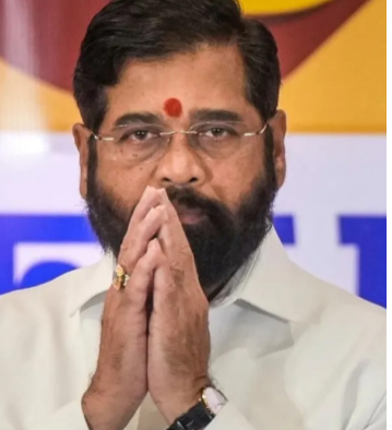
నాపై ప్రేమతో కొన్ని సంఘాల వాళ్లు నన్ను కలిసేందుకు ముందుకు వస్తామని అడుగుతున్నారు. వారు మా పిన్ను అభినానికీ కృతజ్ఞులు. అయితే నాకు మద్దతుగా అలా ఎవరూ రావొద్దని వేడుకుంటున్నాను. శివసేన కార్యకర్తలు వద్దని వాని సీఎం

మహారాష్ట్ర అసెంబ్లీ ఎన్నికల్లో మహాయుతి కూటమి ఘన విజయం సాధించిన సంగతి తెలిసిందే. అయితే ఇప్పటివరకూ ముఖ్యమంత్రి ఎవరు అనే ఉత్కంఠకు తెర వీడలేదు. బీజేపీ నుంచే సీఎం అభ్యర్థిని తీసుకురావాలని పార్టీ అధిష్టానం భావిస్తోంది. మరోవైపు బిహార్ పార్లమెంటు ప్రకారం.. ఏక్స్ నాథ్ పిండేను సీఎంగా కొనసాగించాలని శివసేన కోరుతోంది. ఇలా ఎటూ తేలిచి పరిస్థితి వెలకొన్న నేపథ్యం సీఎం ఏక్స్ నాథ్ పిండే తాజాగా ఎక్స్ వేదికగా చేసిన పోస్ట్ సంచలనంగా మారింది. దీంతో ఆయన సీఎం రేసు నుంచి వైదొలుగుతున్నట్లు ప్రచారం జోరుగా సాగుతోంది. మంగళవారం తెల్లవారుజామున పిండే ఇలా పోస్ట్ చేశారు. " ఎన్నికల్లో మహాయుతి గెలవడంతో మా ప్రభుత్వం మరోసారి రాష్ట్రంలో అధికారం చేపట్టబోతోంది. మహారాష్ట్ర మేము ఎన్నికల్లో కలిసి పోటీ చేశాం. ఇప్పటికీ కూడా కలిసి ఉన్నాం.